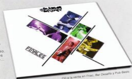
CD a la venta en Fnac, Bar Desafío y Pub Baski

A partir de ahora, pues seguir trabajando en el directo y que la gente disfrute, no queremos parar, queremos tocar cuanto más mejor y que el disco empiece a dar que hablar. Tenemos más ganas que nunca de subir al escenario.